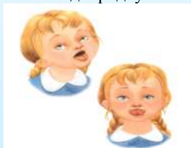
«Накажем непослушный язычок»

Высунуть узкий язык изо рта. Попеременно тянуться им то к носу, то к подбородку.